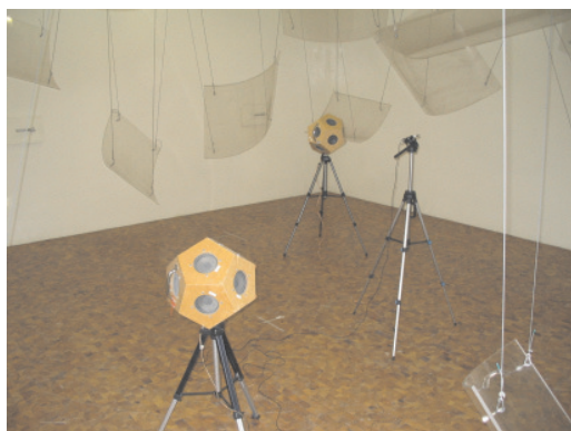
Messungen in Prüfständen und am Bau