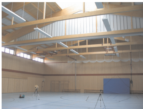
Bau- und raumakustische Sanierung einer Sporthalle